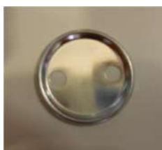
Peça metàl·lica darrera