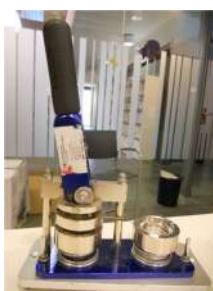
Màquina xapes Ø 38 mm