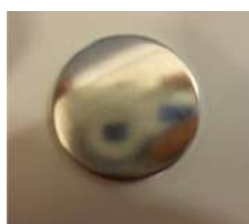
Peça metàl·lica davant