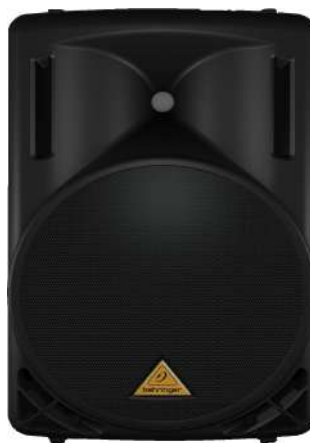
2. altaveus 550W