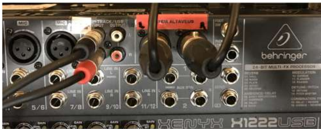
Connexions dels XLR taula

MOLT IMPORTANT: Abans de connectar els cables de corrent assegureu-vos de què TOTS ELS COMPONENTS ESTAN APAGATS I AMB EL VOLUM ABAIXAT . D'aquesta manera ens assegurarem de no trencar ni la taula ni els altaveus.