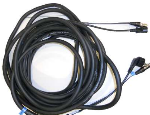
Mànega XLR + C.A. (15 metres)