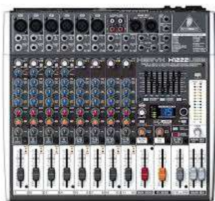
1. Taula de so