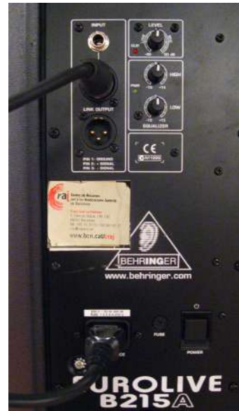
Connexió XLR altaveu Behringer

4. Aleshores podeu connectar també allò extern que necessiteu, ja sigui el micro, un instrument o qualsevol altre dispositiu que pugui adaptar la seva sortida a connexió jack o cànon . En el cas del micro, disposeu del cable dins la caixa. Qualsevol d'aquestes entrades han de ser a partir dels canals de la taula, distribuint-los de l'1 al 6 consecutivament. També connectarem el dispositiu que envii la senyal pel RCA (mp3, pc).