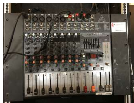
Part superior de la taula