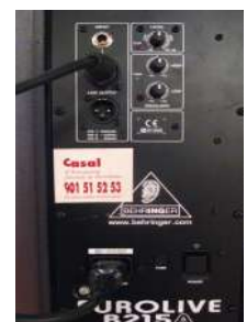
Part posterior altaveu

5. Ja podeu posar en posició ON tots els components, i ajustar el nivell de volum, respectant el recorregut del so. Micro → Taula → Altaveus. 1er encendrem la taula de so , i després els altaveus un per un.