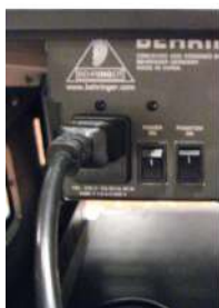
Part posterior de la taula

Un cop realitzades totes les connexions, la vista de les parts hauria de ser alguna cosa semblant a això: